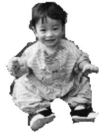
図5 従来手法による結果