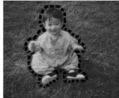
図3 原画と初期輪郭

また、髪の毛と暗い背景のように輪郭付近に輝度の変化があまりみられない領域も、本手法では色による領域分割結果を利用しているため、あまり違和感のない輪郭線が抽出されている。