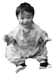
図4 本手法による結果